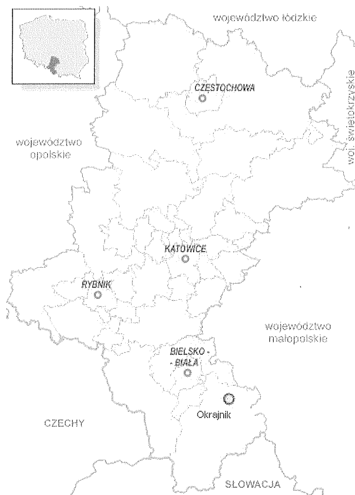
Rysunek 2. Położenie sołectwa Okrajnik na terenie Województwa Śląskiego.