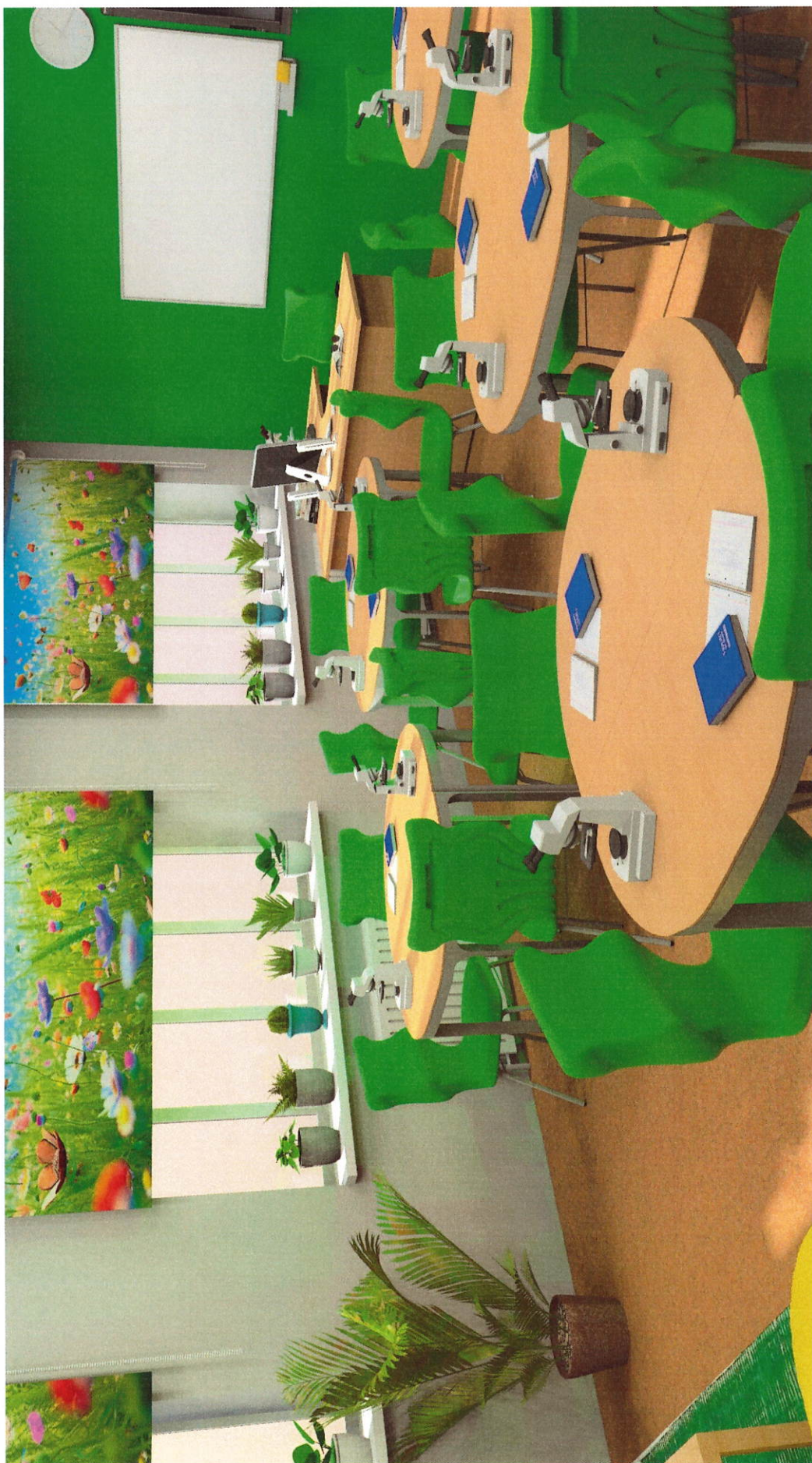
Zdjęcie 5. Widok na nowe stanowiska uczniowskie i fotorolety.